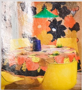
Huipulta haasteisiin -näyttelyn Amico-ruokailuryhmä ja tekstiilit ovat 1970-luvulta.

3 ALASTON TOTUUS -näyttelyssä valokuvaaja Klaus A J Riederer pohtii, oppiiko ihminen koskaan tuntemaan itseään. Kuka on se, joka katsoo sinua peilistä? Näyttely on esillä Kotkan Valokuvakeskuksessa 3. lokakuuta asti.